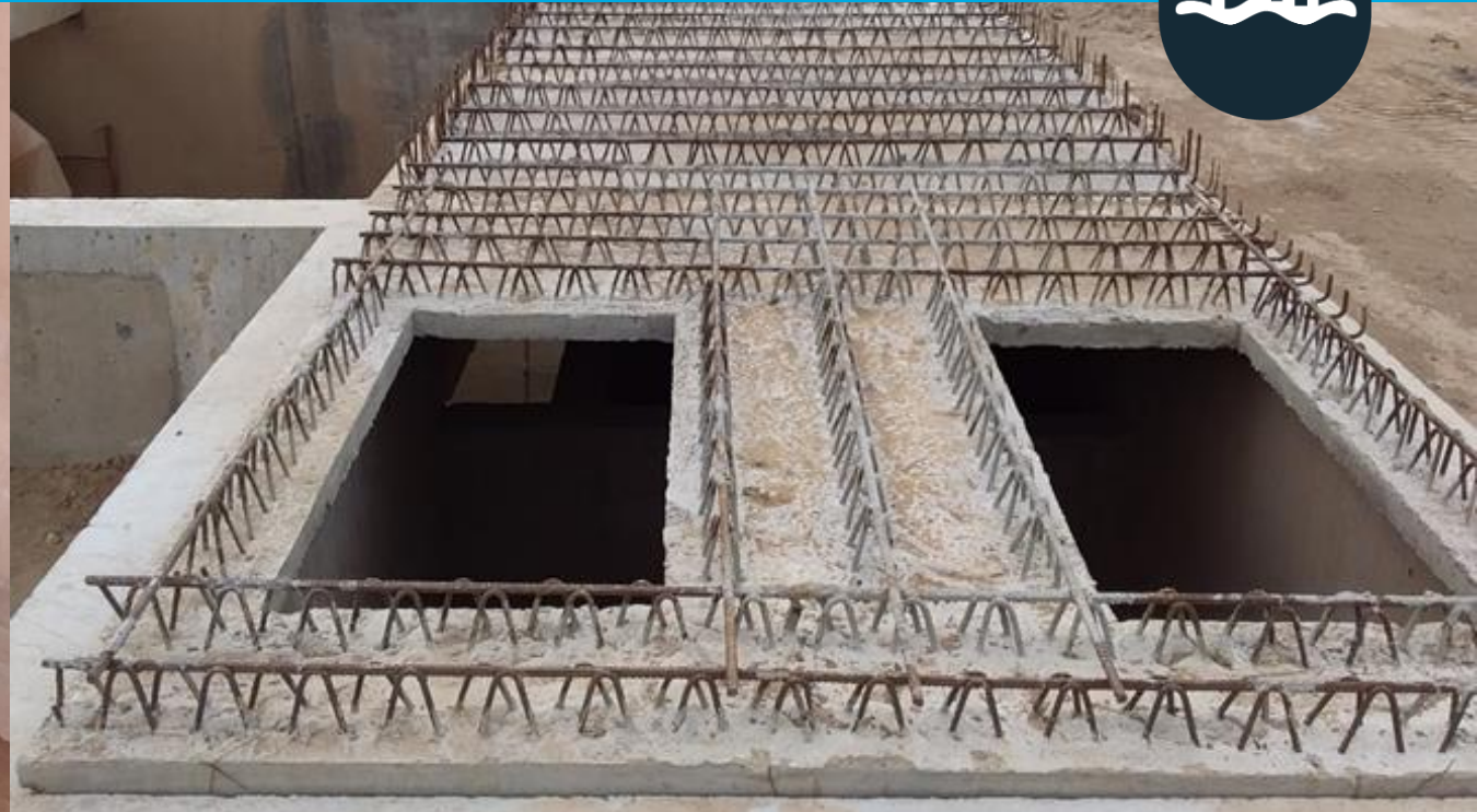
● Cañería interna en Estación de Bombeo